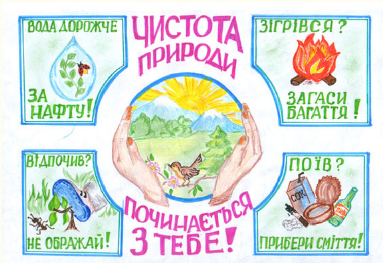
Малюнок А. Пихтіної