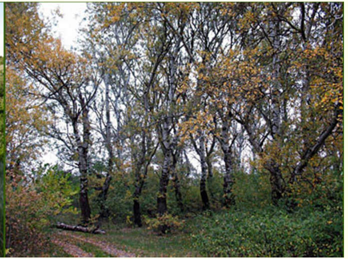
Ландшафтний заказник "Михайло-Ларинський"

Ландшафтний заказник «Півострів Піщаний» – це півострів з фрагментами степових ділянок, заболочених земель, плавневих комплексів, штучних насаджень (садів) та ін. (правий берег р. Інгул, Жовтневий р-н).