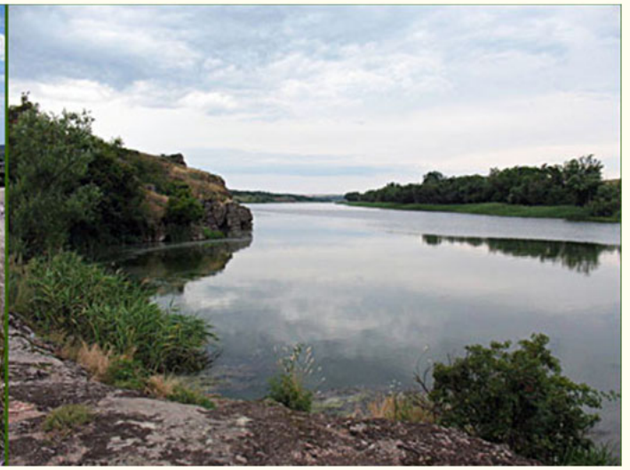
Гідрологічний заказник "Софіївське водосховище"

Це - ботанічні пам'ятки природи «Зелингорова балка» , «Балка Широка» , природний заповідний «Єланецький степ» (басейн р. Громоклія – правої притоки р. Інгул, Єланецький район), ботанічні заказники «Пелагеївський» (правий берег р. Інгул, Новобузький район), «Добра криниця» (лівий берег р. Інгул, Баштанський район), «Михайло-Ларинський» (лівий берег р. Інгул, Жовтневий район), ландшафтний заказник «Привільний» , комплексна пам'ятка природи «Громоклійська круча» (обидва на правому березі р. Інгул, Баштанський район).