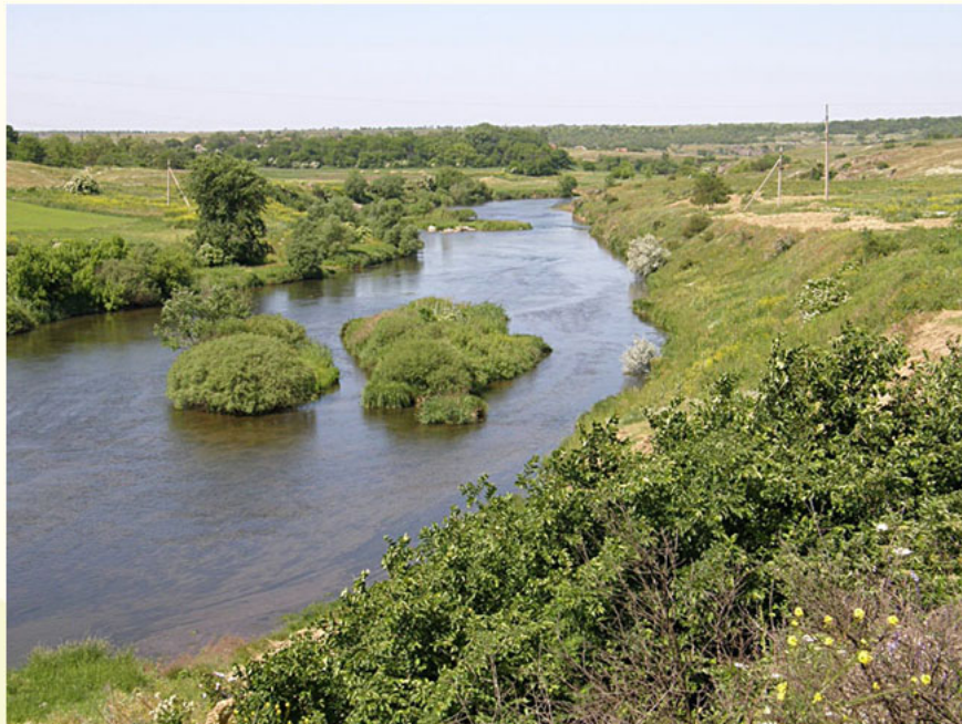
Регіональний ландшафтний парк "Приінгульський"

Це - ботанічні пам'ятки природи «Зелингорова балка» , «Балка Широка» , природний заповідний «Єланецький степ» (басейн р. Громоклія – правої притоки р. Інгул, Єланецький район), ботанічні заказники «Пелагеївський» (правий берег р. Інгул, Новобузький район), «Добра криниця» (лівий берег р. Інгул, Баштанський район), «Михайло-Ларинський» (лівий берег р. Інгул, Жовтневий район), ландшафтний заказник «Привільний» , комплексна пам'ятка природи «Громоклійська круча» (обидва на правому березі р. Інгул, Баштанський район).