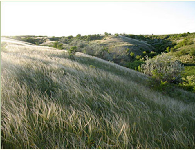
Ландшафтний заказник "Привільний"