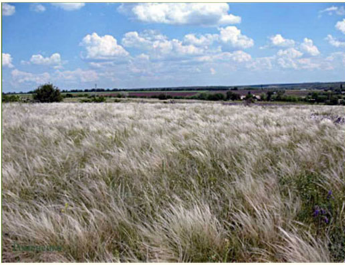
Ботанічний заказник "Пелагеївський"